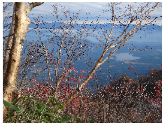
妙高山8合目付近 野尻湖を望む 10月19日

また、子どもを託児所や保育園、親戚等に預けるためにとる経路は、就業のためにとらざるを得ない経路なので、認められます。